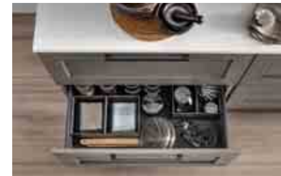
AMBIA-LINE Sistema di suddivisione interna a calamita Finitura Grigio Orione