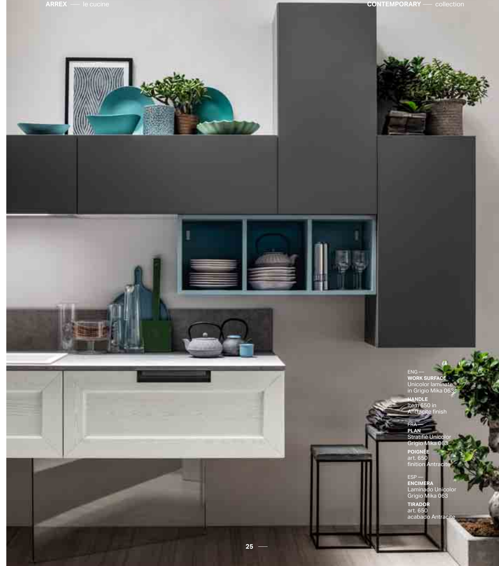
ENG — WORK SURFACE Unicolor laminate in Grigio Mika 063 HANDLE Item 650 in Antracite finish FRA — PLAN Stratifié Unicolor Grigio Mika 063 POIGNÉE art. 650 finition Antracite ESP — ENCIMERA Laminado Unicolor Grigio Mika 063 TIRADOR art. 650 acabado Antracite