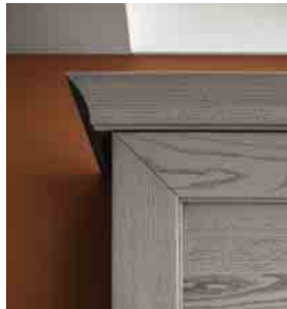
CORNICE SAGOMATA Finitura Frassino Decapè Orione