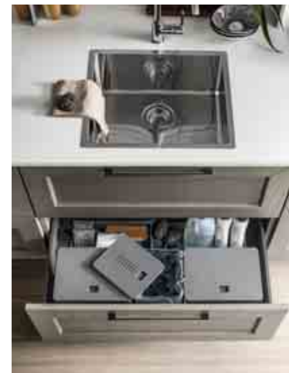
SOTTO LAVELLO 2 cestoni Blum Legrabox Finitura Grigio Orione