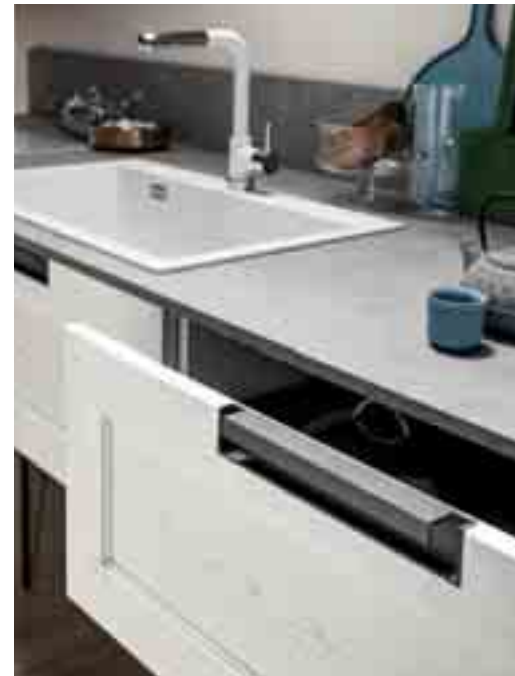
MANIGLIA art. 650 Finitura Antracite

ENG — Modern style made up of clean lines and designer details. FRA — Un style moderne fait de lignes nettes et de détails design. ESP — Un estilo moderno caracterizado por líneas limpias y detalles de diseño.