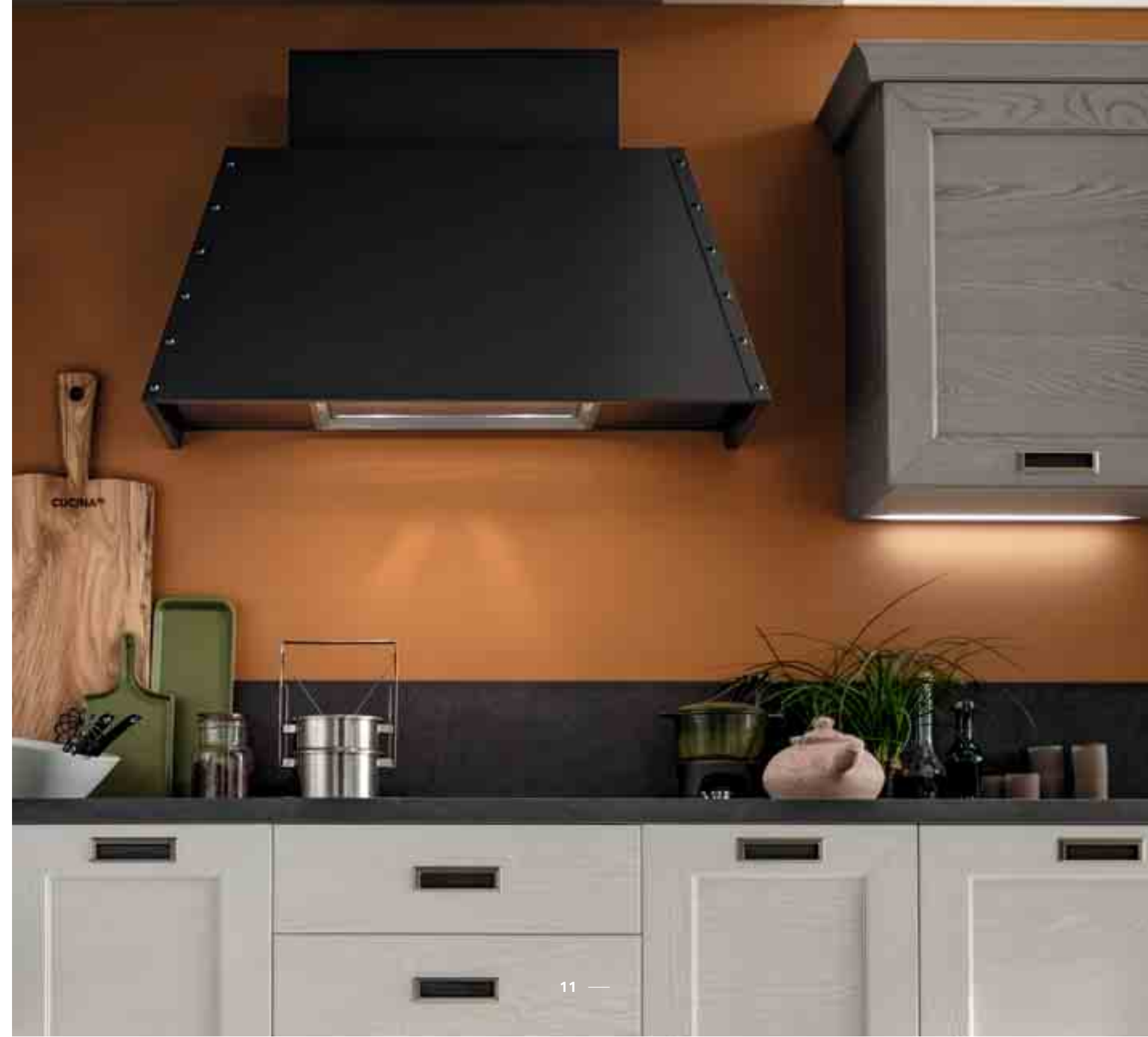
ESP — PUERTA CON MARCO Fresno macizo y plafón central Fresno chapado CORNISA MOLDURADA Acabado Fresno Decapè Orione