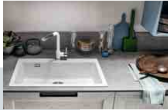
PIANO Laminato Unicolor Grigio Mika 063