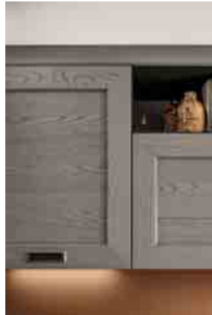
ANTA TELAIO Frassino massiccio e pannello centrale Frassino impiallacciato